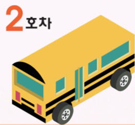
2호차 석적노선 (대형45석)