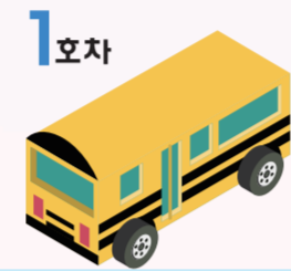
1호차 복합노선 (대형45석)