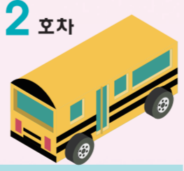
2호차 석적노선 (대형45석)