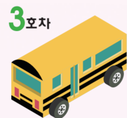
3호차 공단순환 (중형25석)