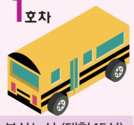
1호차 복합노선 (대형45석)